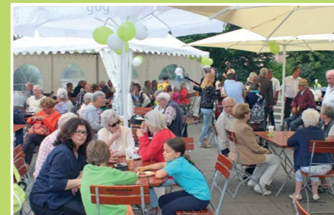
Das hat einfach alles gepasst! Schönes Sommerwetter ohne brütende Hitze und gut gelaunte Gäste. Zum Nachbarschaftsfest der gbg, Anfang Juni in der Theodor-Sturm-Straße, haben sich hunderte Ochtersumer an der Ladenzeile eingefunden, um gemeinsam den Abschluss der Umbauarbeiten an der Ladenzeile zu feiern.