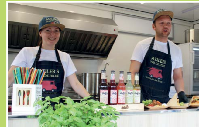
Das Team „Wilde Hilde“ hat den Gästen unermüdlich leckeres Essen zubereitet.

Das Nachbarschaftsfest der gbg am 2. Juni vor der modernisierten Ladenzeile in der Theodor-Sturm-Straße war für alle Beteiligten ein voller Erfolg. An dieser Stelle nochmals vielen Dank allen unermüdlichen Helfern und den vielen, vielen Gästen, die mit uns gemeinsam gefeiert haben!