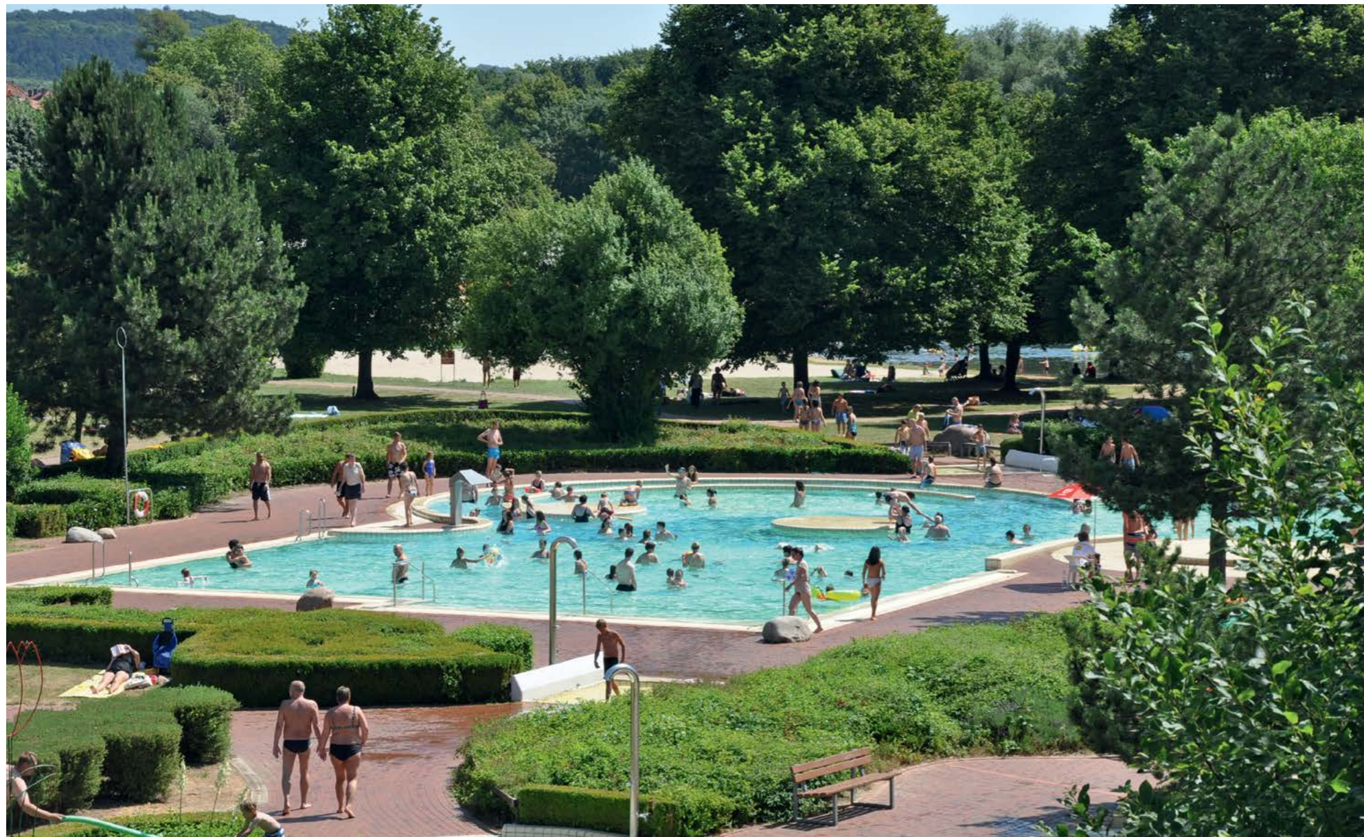
Der Freizeitbereich der JoWiese aus erhöhter Position gesehen. Rund um das Nordufer des Hohnsensees gibt es jede Menge Wasserspaß.

Hier wird das verbrauchte Wasser des Bades über den Umweg des sogenannten Schwallbeckens gepumpt und gereinigt. „Alles was über die Überlaufrinne am Beckenrand wegläuft, landet letztendlich hier in dieser Filteranlage“, erläutert der Schwimmmeister.