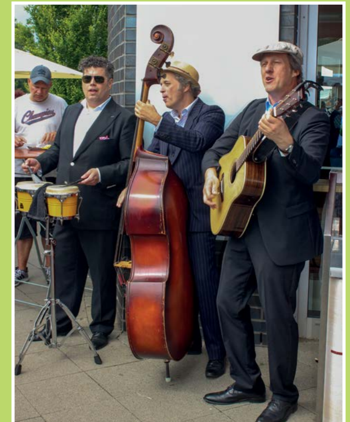
Das Trio Royal sorgte mit handgemachter Musik für richtig gute Laune. Auch auf Wünsche des Gäste gingen die drei Vollblutmusiker immer wieder gern ein.